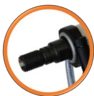
Double emmanchement, Raccord 1¼" UNC & R½"