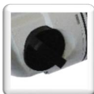
Sélecteur 3 vitesses