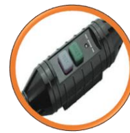
Sécurité Commutateur PRCD 10 MA

Carotteuses professionnelles à 3 vitesses pour carottage manuel ou sur bâti.