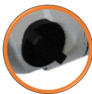
Sélecteur de 3 vitesses 520 / 1400 / 2900