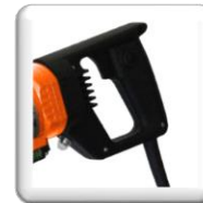
Poignée bêche ergonomique