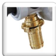
Double Raccord, Tête de chat pour carottage à sec / Gardena pour carottage à eau