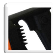
Interrupteur Marche / Arrêt avec régulation de vitesse