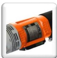
Moteur Électrique 2200 W