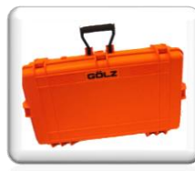
Coffret de transport inclus